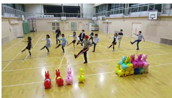
ダンス&ストレッチ