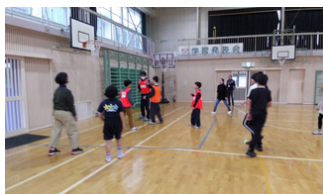
親子レクリエーション