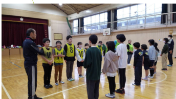
親子レクリエーション