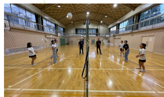
ソフトバレーボール