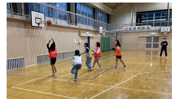
バスケットボール