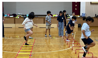
体幹トレーニング