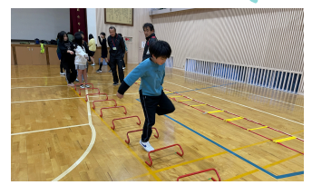
体幹トレーニング